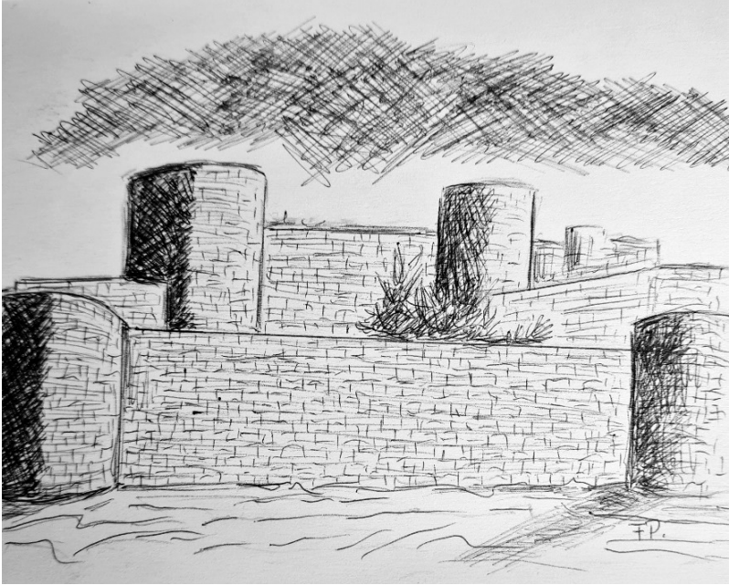
Castillo de Burgos

Solo sabía que, sin ya dolor, la muerte, con su vacío, con su no retorno, me buscaba.